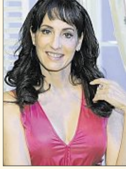
Anna Maria Kaufmann.

Hamburg. (dpa) Die Fans der ARD-Soap „Verbotene Liebe“ dürfen sich über ein prominentes Gastspiel freuen: Die kanadische Sopranistin Anna Maria Kaufmann wird in den Folgen 3422 und 3423 am 7. und 8. Juli mitwirken, teilte die ARD mit. Kaufmann gab schauspielerische Kostproben bereits in den ARD-Krimireihen „Peter Strohm“ und „Tatort“.