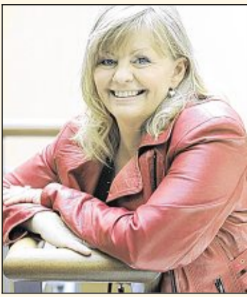
Inger Nilsson.

Hamburg. (dpa) Wenige Tage nach ihrem 50. Geburtstag steht die schwedische Schauspielerin Inger Nilsson wieder für das ZDF vor der Kamera. Nilsson, die als Kind in der Rolle von „Pippi Langstrumpf“ berühmt wurde, begann vergangene Woche mit den Dreharbeiten für zwei neue Folgen der Krimireihe „Der Kommissar und das Meer“ mit Walter Sittler in der Hauptrolle, wie das ZDF mitteilte. Nilsson spielt in der Reihe die Gerichtsmedizinerin Ewa. Die Sendetermine stehen noch nicht fest. Die bereits fertige fünfte Verfilmung ist am 31. Mai zu sehen.